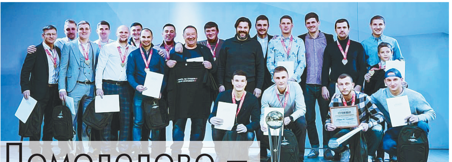
Домodedовский футбольный клуб «Комбинат» стал лучшим на чемпионате России по футболу в формате 8x8.