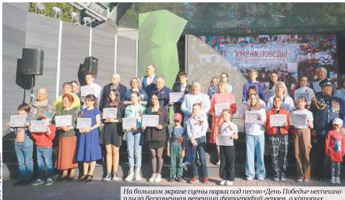
На большом экране сцены парка под песню «День Победы» неспешно плыла бесконечная вереница фотографий героев, о которых сняли не один десяток видеороликов. Это наша история, и мы её помним! /