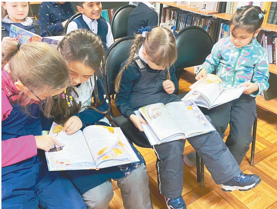
Во время встречи с первоклассниками в центральной детской библиотеке

В феврале ученики третьих-четвёртых классов во всех школах нашего городского округа читали мою книгу «Кот из ресторана». Книга с картинками, составлена из невыдуманных историй о животных. Как-то получилось, что в краткий временной промежуток на меня эти истории просто высыпались: их рассказывали близкие, друзья, совсем малознакомые люди, а я бежала к компьютеру и быстренько записывала, боясь запамятовать и пропустить подробности. Это была веселая, радостная, счастливая работа – подобрать слова, расставить их в нужном порядке, и больше ничего, потому что каждая история уже содержала в себе начало, развитие и некий жизненный урок. И ничего не надо было выдумывать. Получилась неожиданная книжка. Вышла она в 2008-м, но каждый год подрастают новые малыши, которые ее читают. Я очень рада, что у книжки оказалась такая счастливая судьба. Это счастье перепадает и мне.