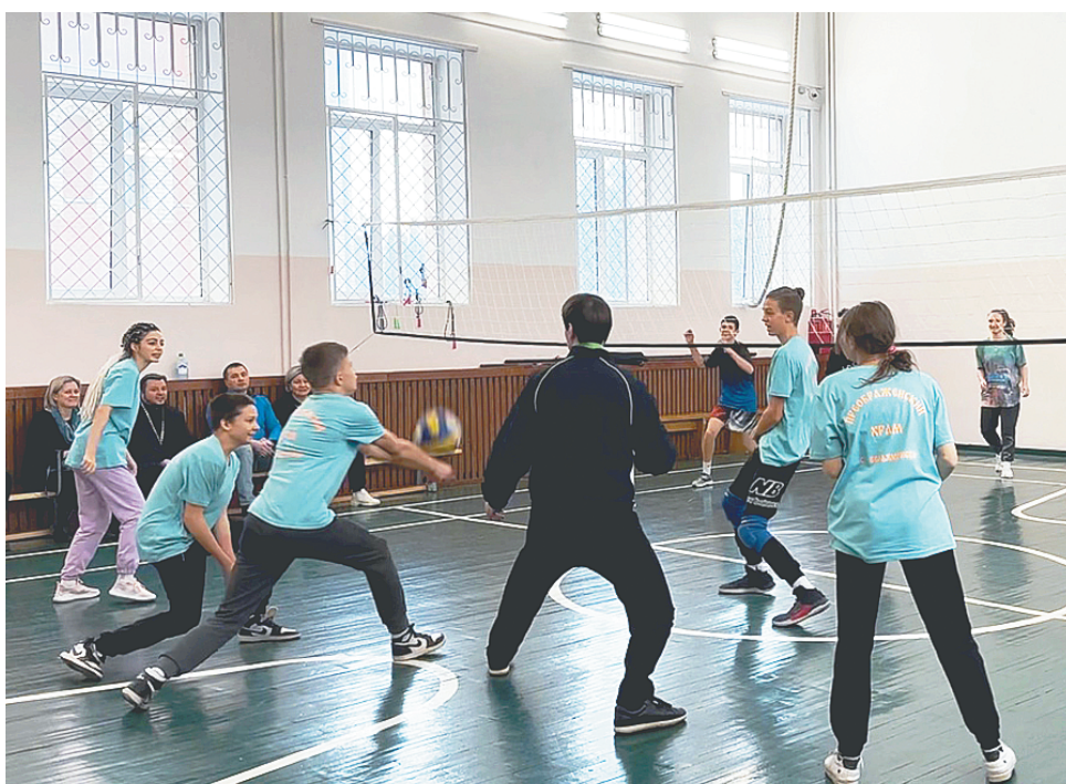
Во время соревнований по волейболу

Светлана ГОНЧАРОВА. Фото из архива собора.