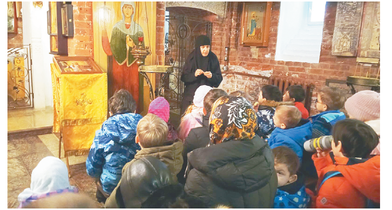
В нижнем храме Серафимо-Знаменского скита

12 февраля учащиеся воскресной школы собора Всех святых, в земле Российской просиявших, города Домодедово совершили памятную поездку в Серафимо-Знаменский скит села Битягово.