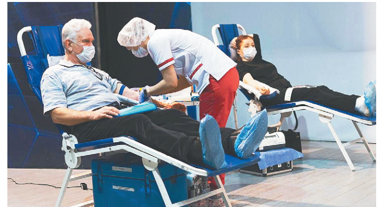
Во время донорской акции

14 февраля, в преддверии Сретения Господня, в молодежном центре «Победа» города Домодедово состоялась благотворительная донорская акция. На мероприятие пришли 88 неравнодушных жителей округа. В результате акции заготовлено 34 литра донорской крови в помощь детям с онкологическими заболеваниями.