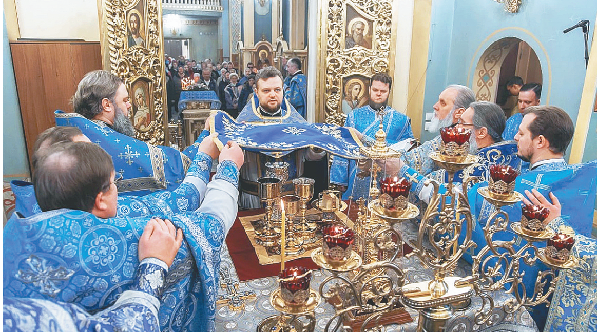
Молитва в алтаре