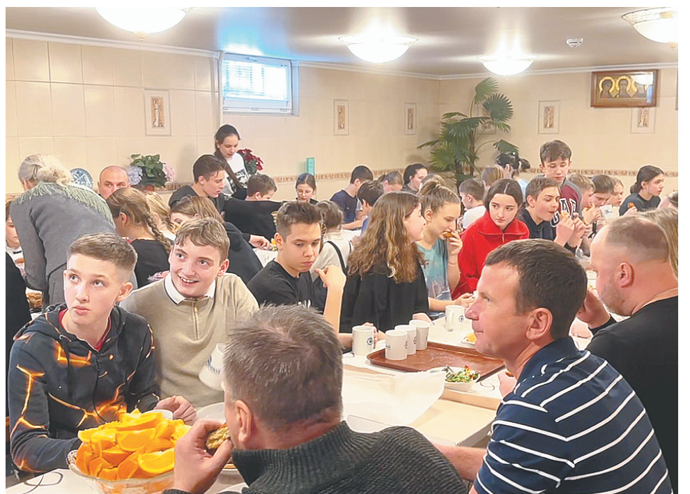
За чаем молодёжь продолжала весело общаться