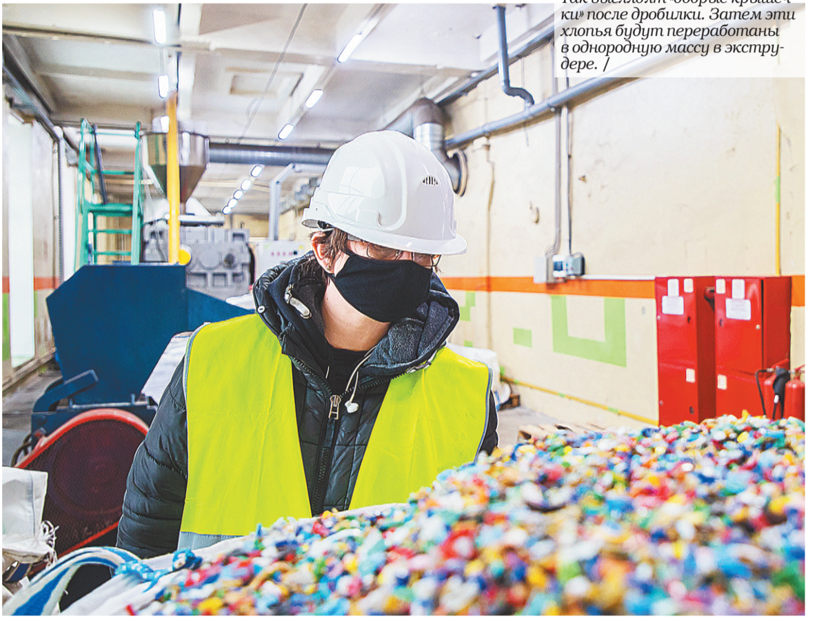
Так выглядят «добрые крышечки» после дробилки. Затем эти хлопья будут переработаны в однородную массу в экструдере.