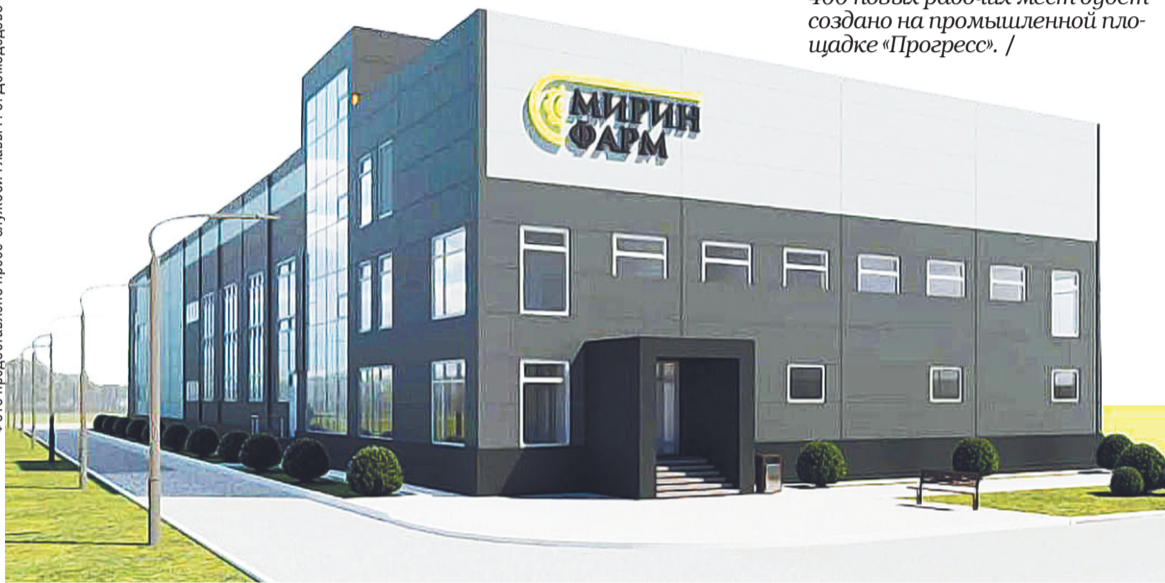
400 новых рабочих мест будет создано на промышленной площадке «Прогресс»