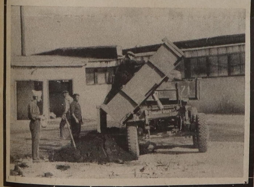
15 СОЮЗНЫМ НА ЮБИЛЕЙНОЙ ВАХТЕ

Близится день великого праздника - 50-летие образования СССР. И вполне понятно стремление каждого труженика отметить эту дату как можно особенно. Закончился рабочий день, но рабочие, инженерно-технические работники, служащие завода "Кондиционер" после смены собрались для того, чтобы обсудить и поддержать по речи коллектива рабочих Электростальского завода тяжелого машиностроения. Минтип открыл секретарь партбюро завода В.Г. Солдатов. Он рассказал о почине электростальцев - трудиться каждую из оставшихся недель в честь одной из братских социалистических республик.