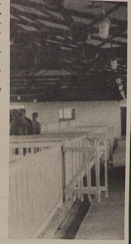
На снимках: 1. Общий вид животноводческого комплекса. 2. В этом помещении разместятся телята. 3. Благоустройство территории.

Каждый год совхоз "Барыбино" испытывал большие трудности с размещением скота. Те дворы, которые остались хозяйству в наследство, ветшали. Хотя их и ремонтируют, но комплексную механизацию применить нельзя. А это значит, что дояркам, скотникам, телятникам приходится вручную раздавать корма, ухаживать за помешениями.