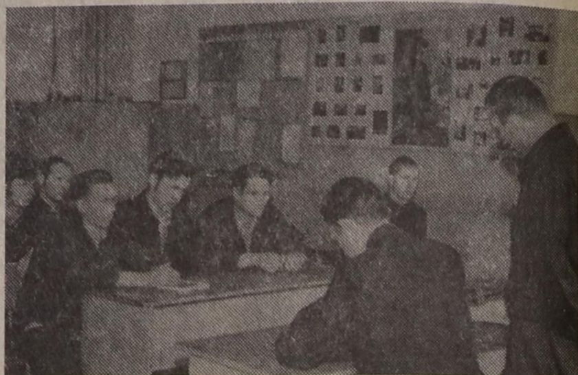
На настоящее время в цехах аэропорта Домодедово прошли отчетно-выборные собрания коммунистов партгрупп