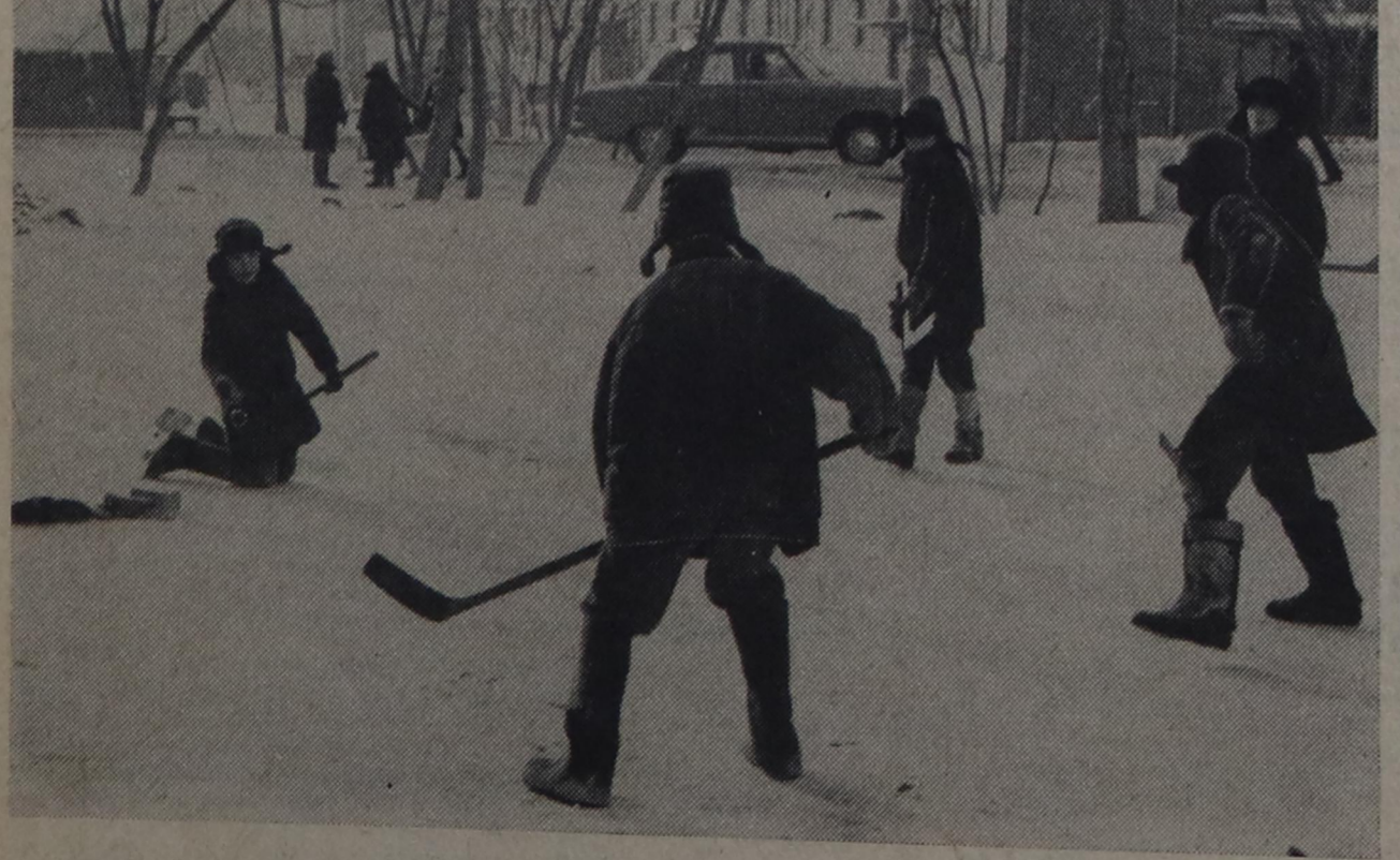
«Чемпионат на Каширке».