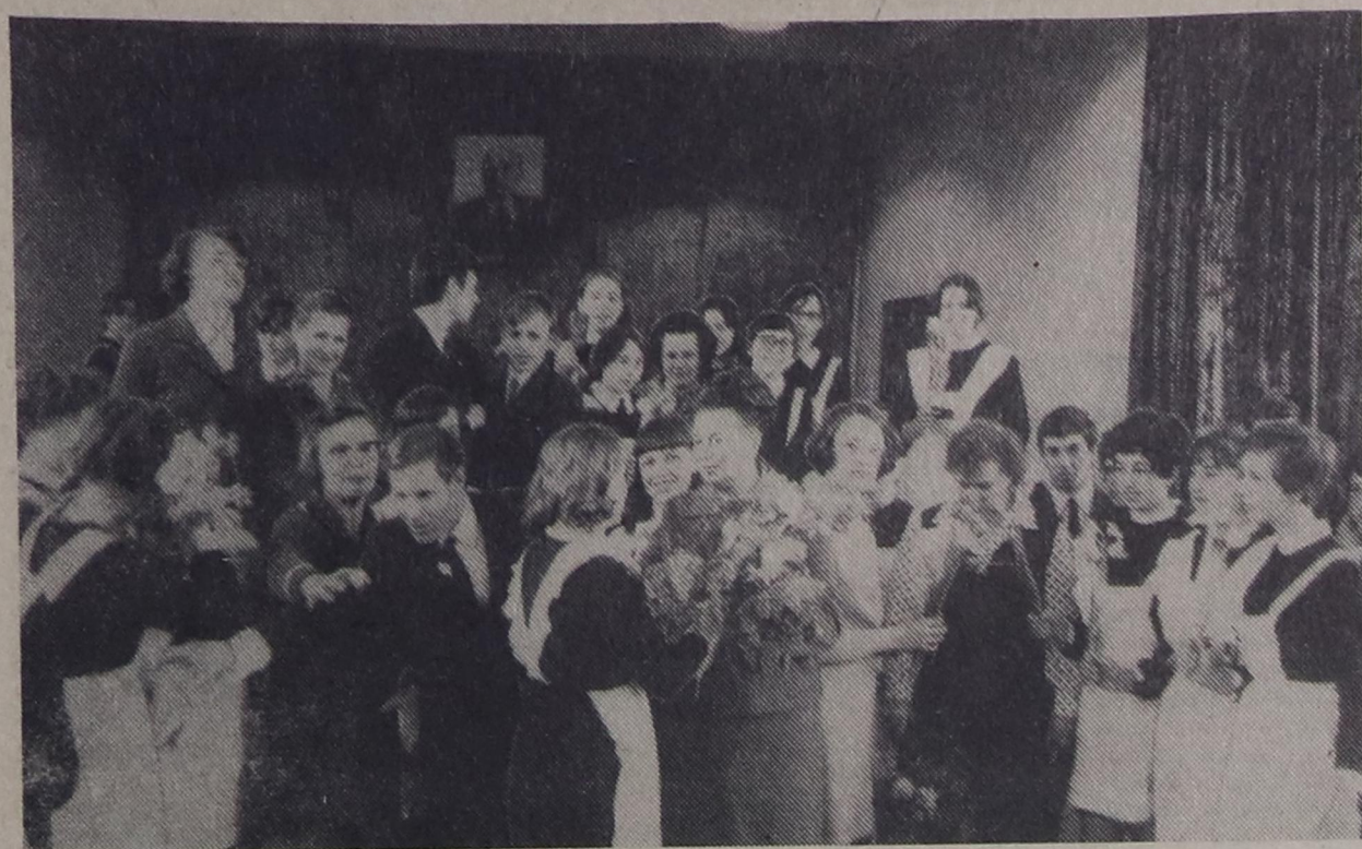
ПРОЩАЛЬНЫЙ БАЛ, ПРОЩАЛЬНЫЙ ВАЛЬС И ВЕСЕЛО, И... ГРУСТНО. СЕГОДНЯ ЮНОШИ И ДЕВУШКИ БЕЛОСТОЛБОВСКОЙ СРЕДНЕЙ ШКОЛЫ ПРОЩАЮТСЯ СО СВОИМИ НАСТАВНИКАМИ, ДАВШИМИ ИМ ПУТЕВКУ В ЖИЗНЬ. ОСТАЛИСЬ ПОЗАДИ ШКОЛЬНЫЕ ГОДЫ. РЕВЯТАМ НЕВДОМЕК, А УЧИТЕЛЯ